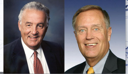
21'inci yüzyılın Solonları. Senatör Paul Sarbanes (D-MD) ve Temsilciler Meclisi Üyesi Michael G. Oxley (R-OH-4). Yasa Temsilciler Meclisinde 3'e karşı 423 ve Senatoda 0'a karşı 99 oyla kabul edildi.

— ABD'de yürürlükte olan Sarbanes-Oxley Yasası (SoX) tüm şirket yönetimini kamu etiğinin denetimi altına getirir. Yasa sözde "iyi" olduğu ileri sürülen hırs etmeninden özgürlüğün tikel bir anlatımıdır. Enron ve WorldCom gibi büyük şirket skandallarına tepki olarak çıkarılan yasa Türkiye, Kanada, Almanya, Güney Afrika, Fransa, Avustralya, Hindistan, Japonya, İtalya ve İsrail tarafından da kabul edildi.